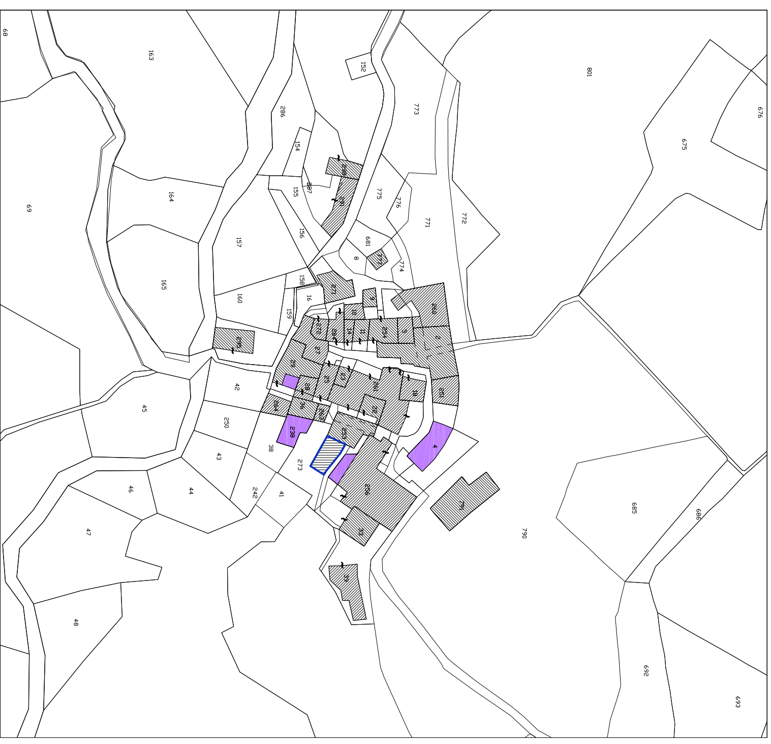
COMUNE DI TRESANA - Piano di Recupero di Tavella Quadro conoscitivo. Estratto di mappa catastale: Fig. 34, Sviluppo A - Aggiornamento catastale